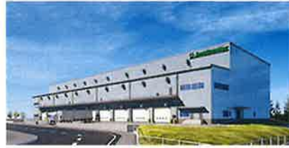
愛西物流センター完成予想図

日本ロジスティクスファンド投資法人(東京都千代田区西神田3-2-1、03-3238-7171)は愛知県愛西市で賃貸用物流施設を取得する。ロンコ・ジャパン(大阪市東成区)が建屋を建設後、土地・建屋を取得する計画。ロンコ・ジャパンは用地1万68㎡に鉄骨造り3階建て延床面積1万4,210㎡の建屋を建設する。施工は矢野建設(名古屋市港区)が担当。2019年3月の着工と2020年2月の竣工を予定している。なお、建屋竣工後はロンコ・ジャパンがテナント企業として入居を予定している。